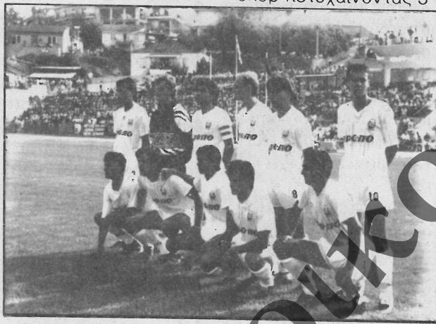
Η ομάδα της Νάουσας του Κυπέλλου στο ΚΥΠΕΛΟ

φου ήταν η τελική νικήτρια αφού οι ποδοσφαι-